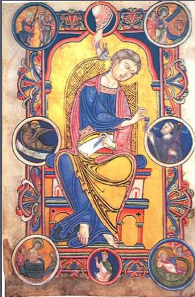
Св. евангелист Иоанн из Евангелия аббата Ведрикуса. Не ранее 1147г. Общество археологии и истории. Авер-сюр-Эльп, Франция.

Мистецтво скульптури і розпису було пов'язане з мистецтвом книжкової мініатюри , розквіт якої доводиться на романську епоху