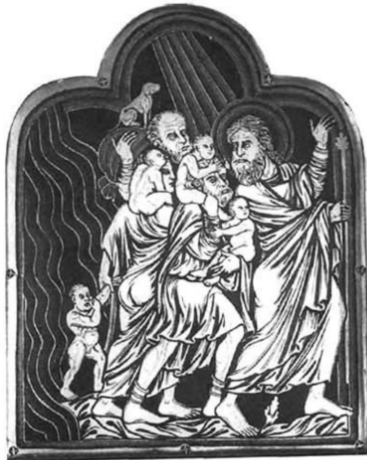
Николай из Вердена. Переход через Черное море из Klosterneuburgского алтаря. 1181г. Эмаль по золоту. Klosterneuburgское аббатство. Австрия.