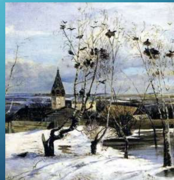
А.К. Саврасов. Грачи прилетели