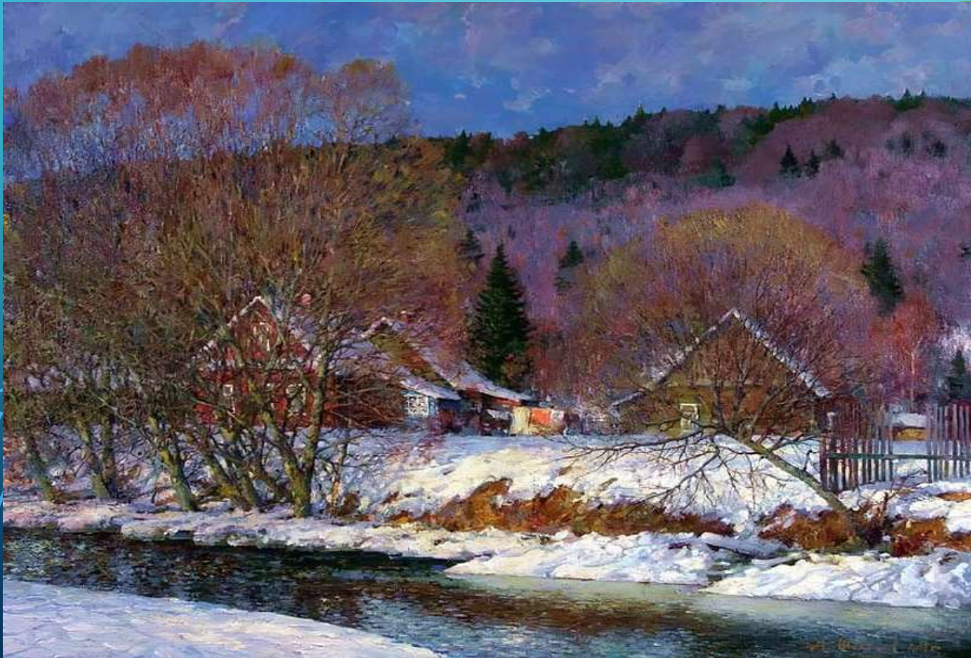
А. Шевелёв. Весна

СОСТАВЬТЕ ДВА-ТРИ ПРЕДЛОЖЕНИЯ (1 ГРУППА - УТВЕРДИТЕЛЬНЫХ; 2 ГРУППА - ОТРИЦАТЕЛЬНЫХ), ОПИСЫВАЮЩИЕ ВЕСЕННИЙ ПЕЙЗАЖ, КОТОРЫЙ ИЗОБРАЖЁН НА КАРТИНЕ А. ШЕВЕЛЁВА «ВЕСНА»