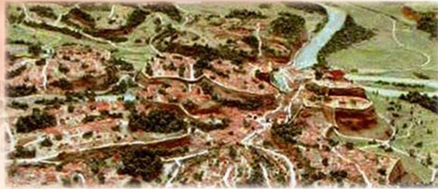
Пагорб Палатин – жили багаті та знатні люди