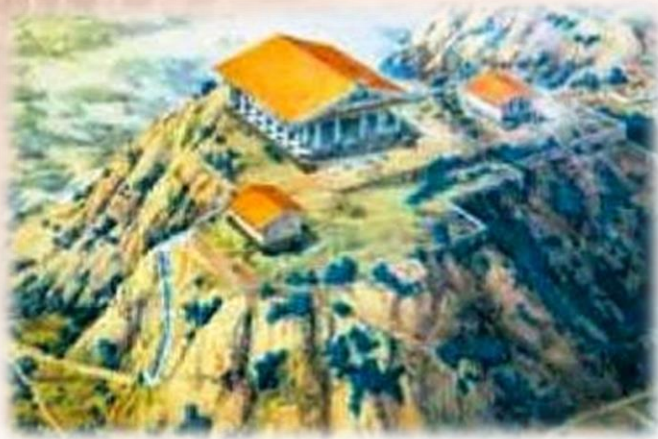
На Капітолії збудували фортецю і головний храм