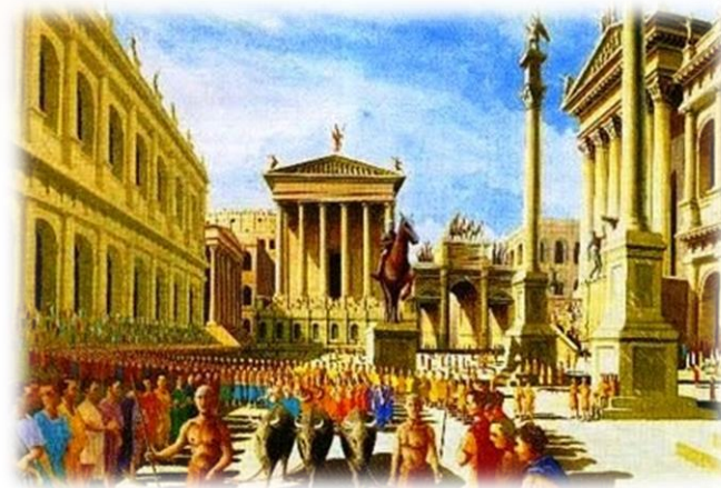
Форум – ринкова площа